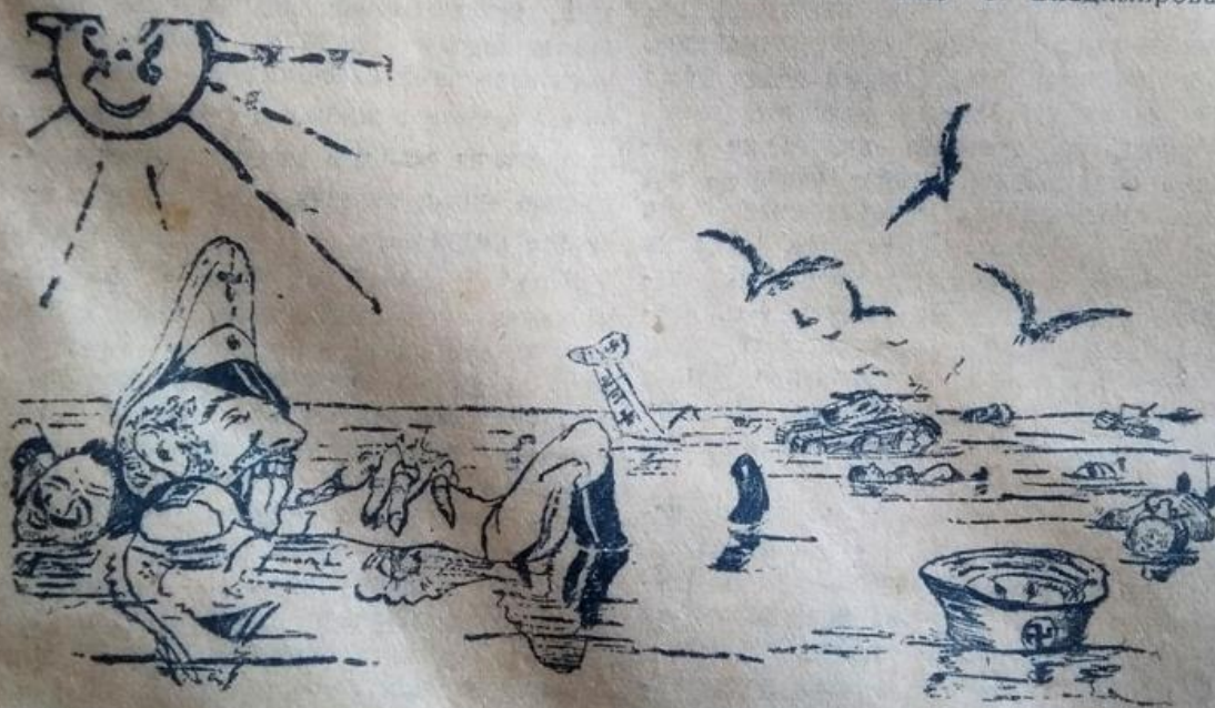
Рис. С. Владимирова.

В Крыму обогреться спеша, Не ждали фашисты отпора, И «плавают» гнусная свора В холодной воде Сиваша.