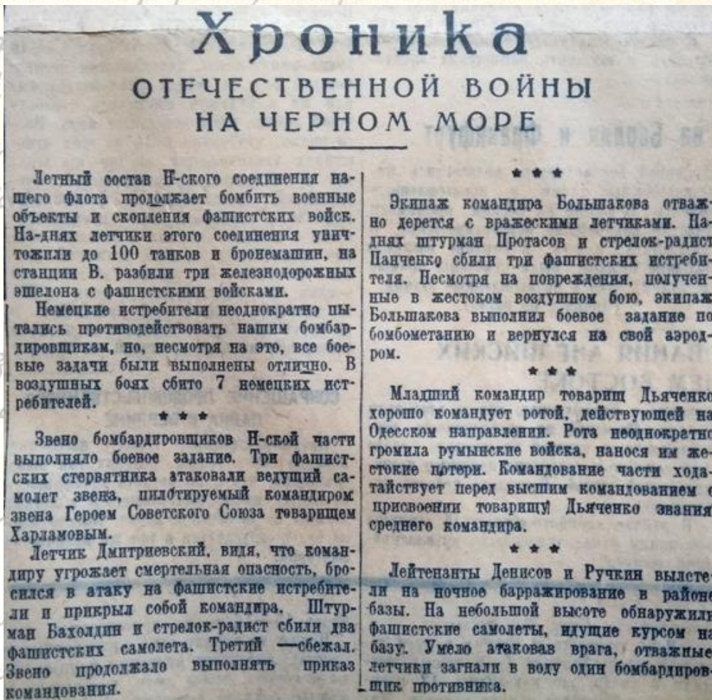
Хроника Отечественной войны на Черном море // Красный черноморец. – 1941. – 4 сент. (№ 268). – С. 3.