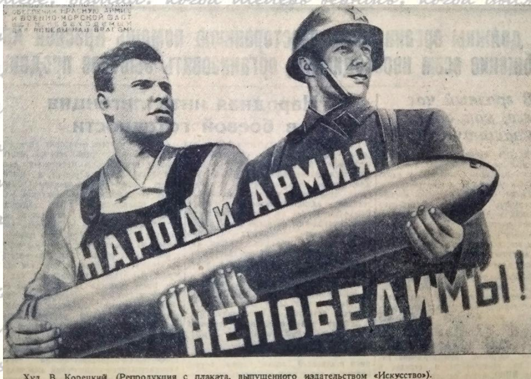
Худ. В. Корецкий. (Репродукция с плаката, выпущенного издательством «Искусство»).